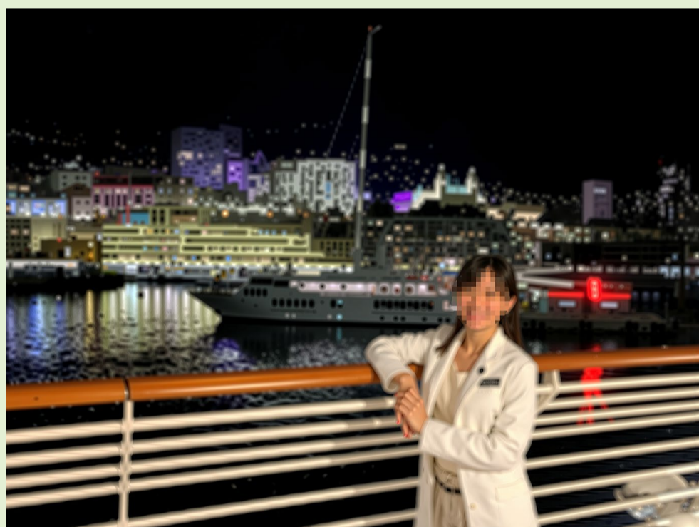
■デッキでしばしの休息。馴染んだ白衣(会社支給)姿が、格好良い。

身をもって体験した近況説明は、寺子屋生の中に英会話の勉強を始めるなど、更なる向上心へと仲間の歩みを進めることになったようです。