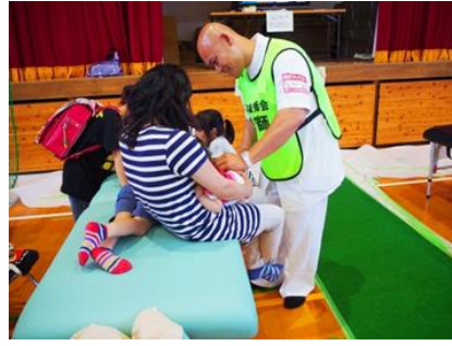
* 益城町・・・保健福祉センターはびねす (7月26日終了)