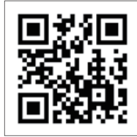
WMG 2021 公式サイト

同時に大会にスポーツ鍼灸ボランティアとして参加をしていただける先生方も募集しています。先生方と一緒に活動が出来る事を楽しみにしています。